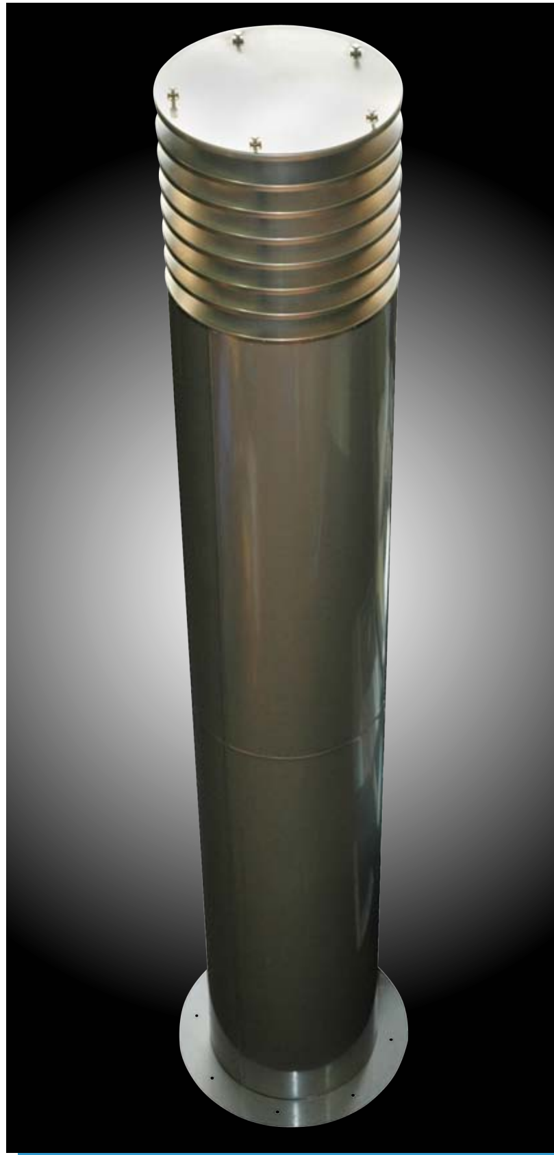
Chapeau à colonne à lamelles CASTOR type CRL-SH