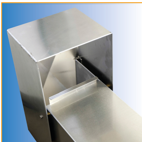
Immagine da sotto