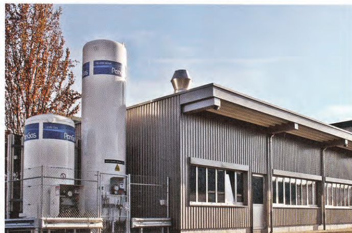
La nouvelle halle de production.