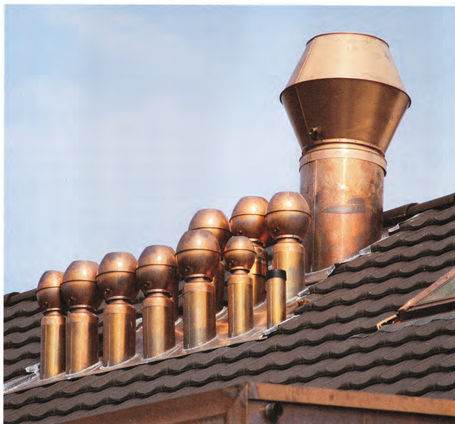
L'extracteur statique Antares®: Le système a fait ses preuves grâce à un concept de fabrication très compact, qui lui confère des propriétés efficaces contre les refoulements.

La fabrication de coiffes et de systèmes de ventilation est la deuxième activité clé de la société zougnoise. Régulièrement elle