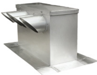
Dachhaube RF: gedämmt, mit seitlichen Rohrstützen, Deckel demontierbar.

Der Ohnsorg-Abluftregenhut sorgt bei jedem Entlüftungssystem und bei allen Wetterlagen für einen ungehinderten Ablufttransport. Der Regen wird aufgefan-