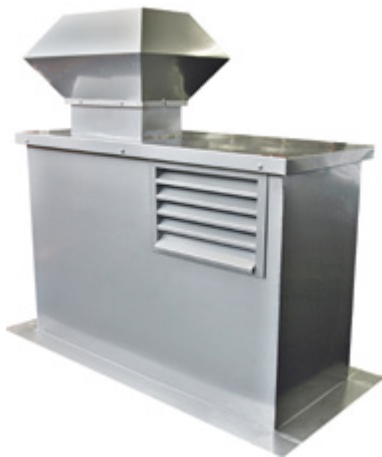
Dachhaube Duo: Fortluft und Aussenluft kombiniert, inkl. Abluftregenhut und Wetterschutzgitter, gedämmt.