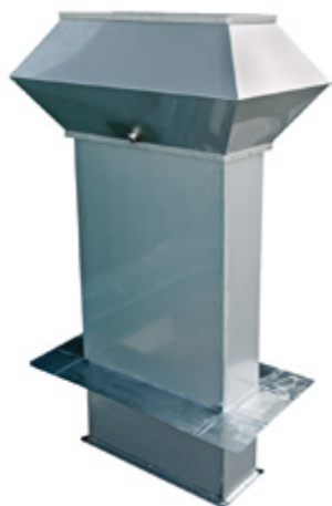
Abluftregenhut AEID-F: bikonischer Fortlufthut, eckig, doppelwandig gedämmt.

Die Ventilationsartikel werden nach Kundenmass und in den verschiedensten Werkstoffen angefertigt. Dank der modernen Produktionskette werden nur wenige Tage für die Herstellung benötigt. ■