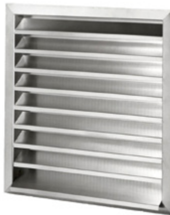
Wetterschutzgitter: innenseitig mit Edelstahl-Schutzgitter, Maschenweite 10/10 mm, freier Querschnitt 65%.